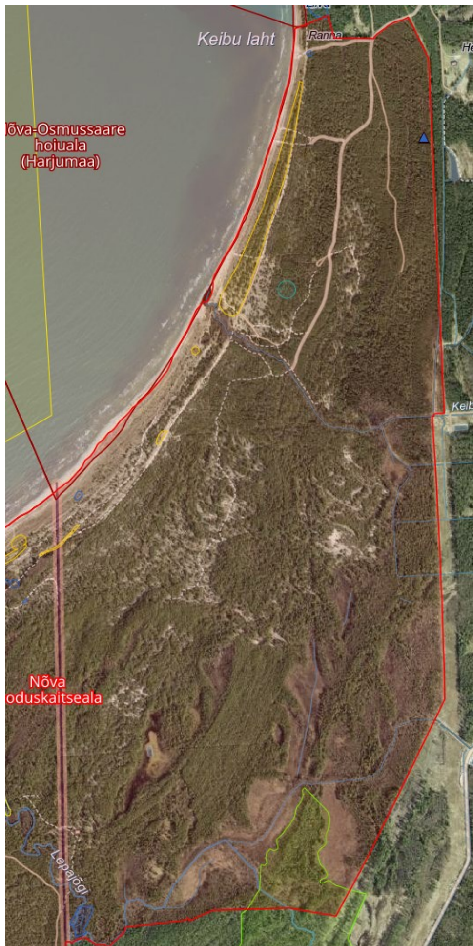
Joonis 2. Nõva looduskaitseala Harjumaal. Sinise värviga on kujutatud III kaitsekategooria liigid, kollase värviga II kaitsekategooria liigid ja rohelise värviga I kaitsekategooria liigid.